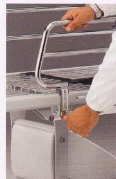
Pulsante di sblocco sponda Button for side rail unblocking