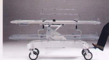
Barella altezza variabile Stretcher adjustable height