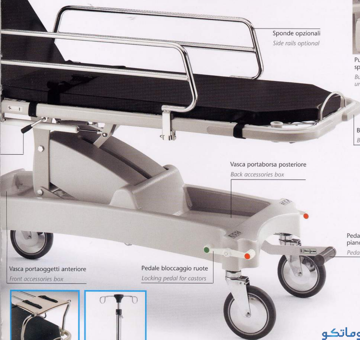
Sponde opzionali Side rails optional