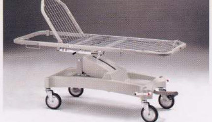
Barella senza accessori Stretcher without accessories