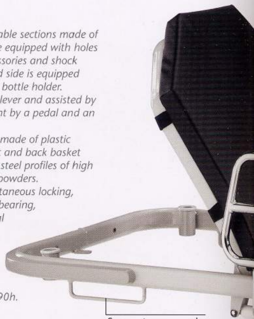
Supporto per sacche Bag support

Overall dimensions cm 204x70x53/90h. Base dimensions cm 198x58 Backrest inclination from 0° to 80° Minimum height 53 cm Maximum height 90 cm Castors Ø cm 20 Weight kg 95 Safe working load 170 kg Height of the side rails from the sprung base cm 28 Minimum height from the floor and the basement cm 10 Maximum height from the floor and the basement cm 25 Maximum useful space between sprung base and basement cm 43 Medical device class I following dir. 93/42CEE