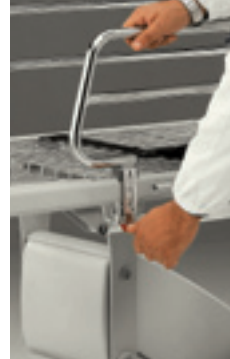
Pulsante di sblocco sponda