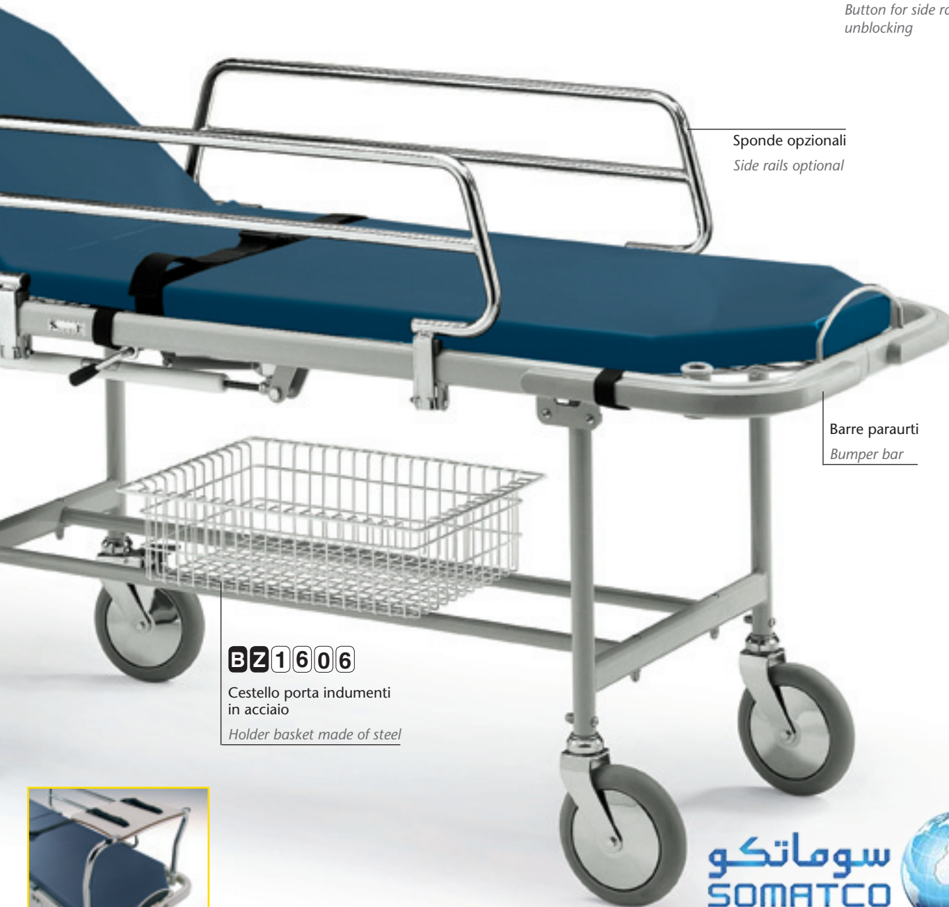
Sponde opzionali Side rails optional